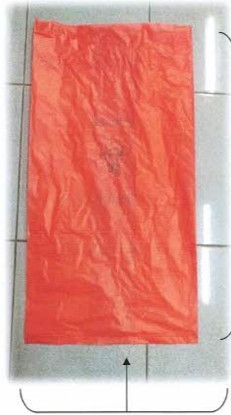
สูง ๒๔ นิ้ว