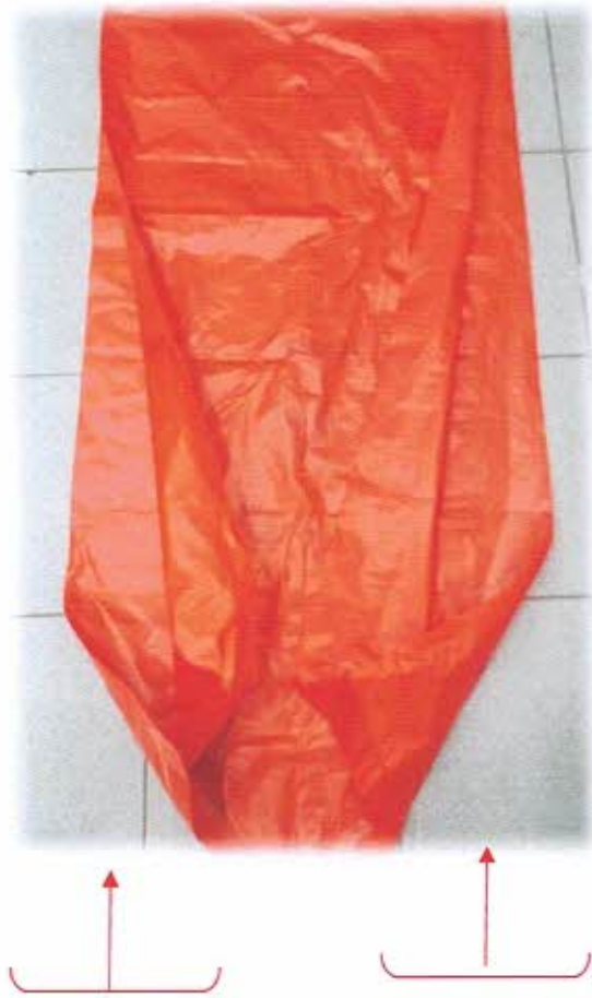
พับข้างๆละ ๕ นิ้ว

ถุงพลาสติกสีแดง HDPE ขนาด ๑๕ x ๒๔ นิ้ว (ด้านหลัง)